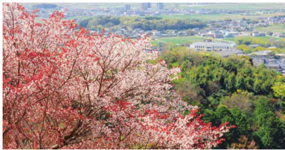
桜の季節～京ヶ峰山頂より当院を望む～