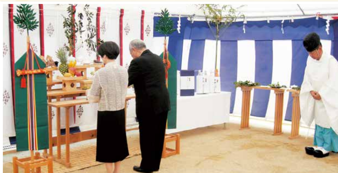
新病棟 地鎮祭にて