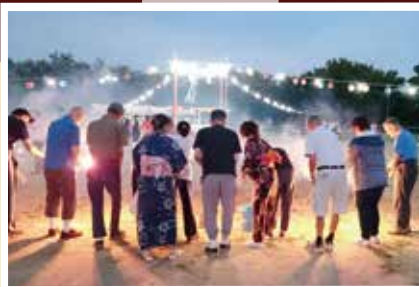
「開院80周年記念 夏まつり」 8月8日(水)

メンバーと相談して「天の丸」へ行ってきました。今年には宴会で、「おどるボンポコリン」を歌って踊って盛り上がった旅行でした。