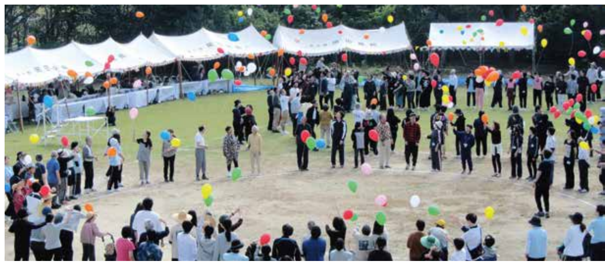
開院80周年記念 大運動会