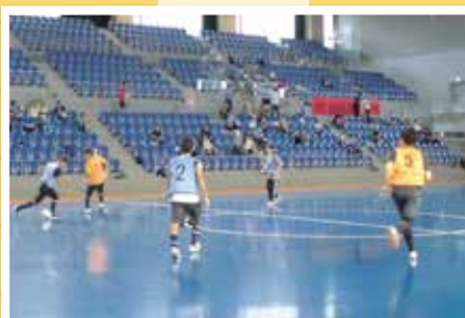
「第5回 星城カップ(フットサル大会)」 9月10日(月)

普段練習するホールより、とても大きな「武田テバ オーシャンアリーナ」を会場に行われました。緊張しながら試合を行ない1勝することができ、良い経験ができました。