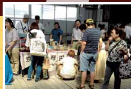
「希望会バザー」 9月6日(木)・7日(金)

患者さん、ご家族、そして地域のみなさまに大勢ご来場いただき、盛大に開催することができました。80周年を記念して、例年より多くの花火を打ち上げてお祝しました。