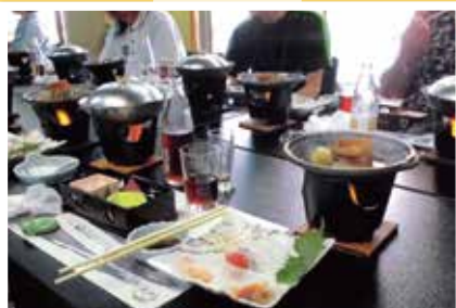
「ダイケアー泊旅行」 7月24日(火)～25日(水)

メンバーと相談して「天の丸」へ行ってきました。今年には宴会で、「おどるボンポコリン」を歌って踊って盛り上がった旅行でした。