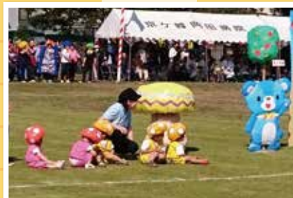
「開院80周年記念 大運動会」 10月20日(土)

普段練習するホールより、とても大きな「武田テバ オーシャンアリーナ」を会場に行われました。緊張しながら試合を行ない1勝することができ、良い経験ができました。