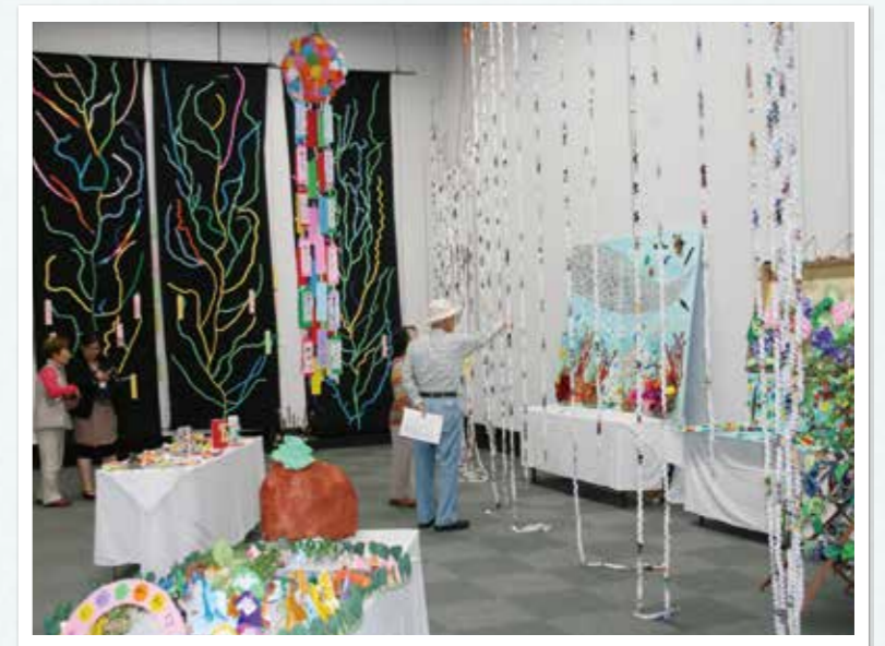
力作をじっくり鑑賞される来場者

平成25年6月26日(水)～30日(日)の期間に岡崎市明大寺町にある岡崎市美術館で開催しました。今年のテーマ『伸びる』にちなんだ色々なものが展示されました。個人から団体作品まで応募総数は約200点余りとなり、今年は650名の方々に来ていただきました。