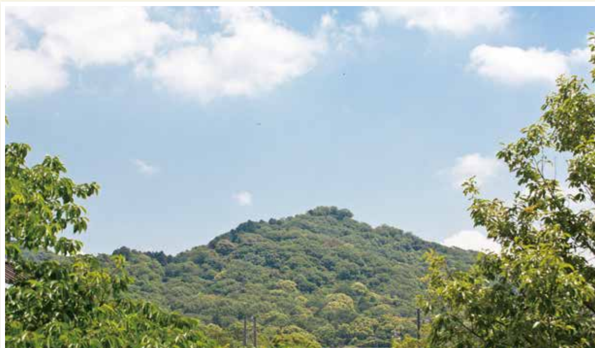
芳精倶楽部会館から望む京ヶ峰

当院は、昭和13年4月に現院長の父上により、岡崎市康生町に有床診療所「岡田医院」として開設されてから、今年で75年になります。